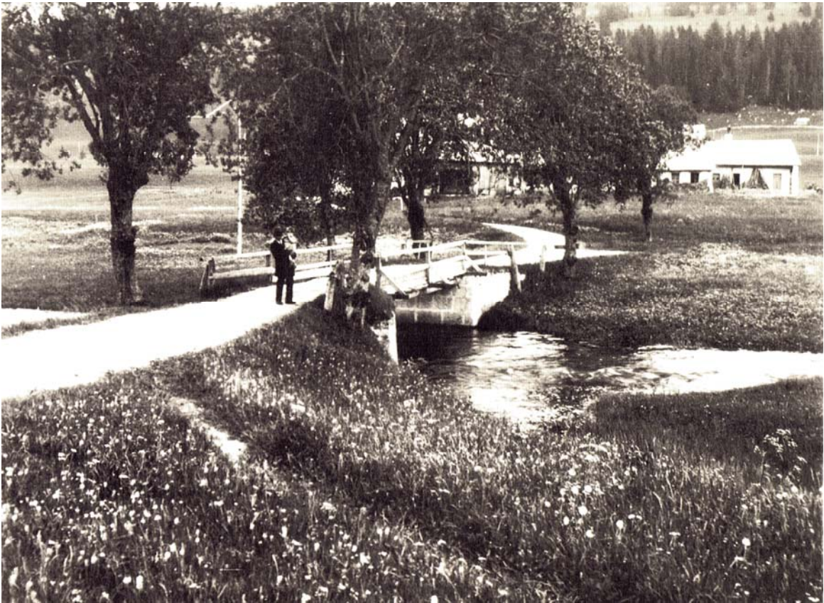
Pont dit des Scies vers 1930.