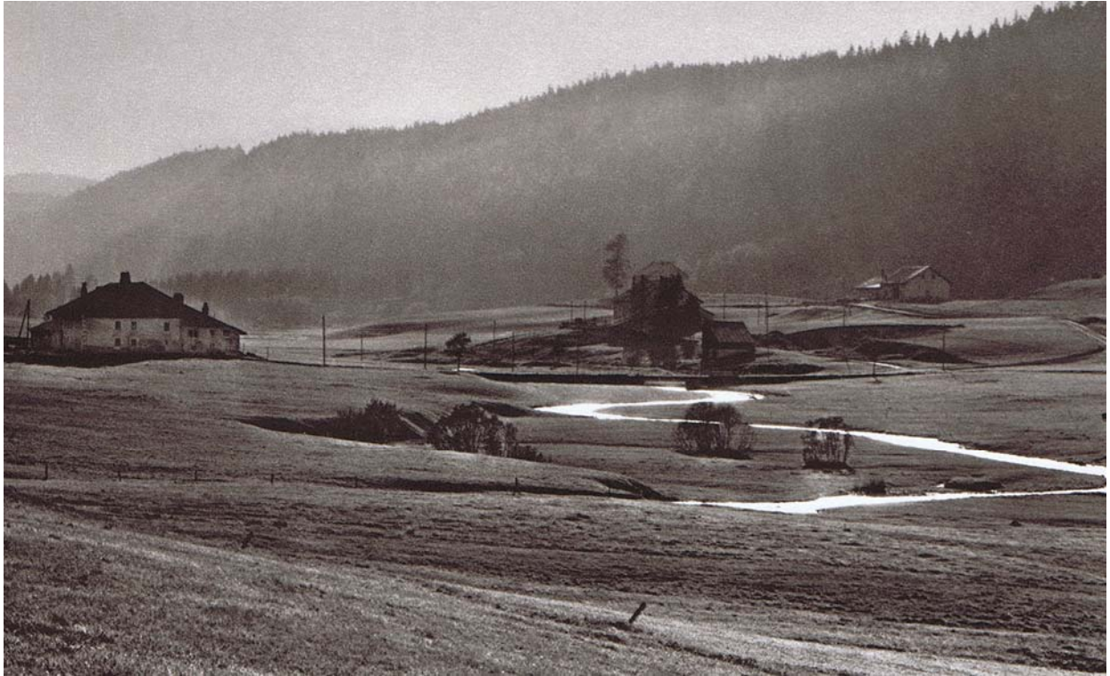
Les Orbettes à gauche, et le pont des Scies au milieu. Magnifique photo de Max-F. Chiffelle dans : Charles-Ad. Golay, La Vallée de Joux et la Fabrique Le Coultre, Le Griffon, 1958.