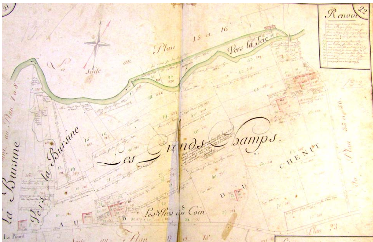
Le pont de Vers la Scie, avec le hameau des Orbettes.