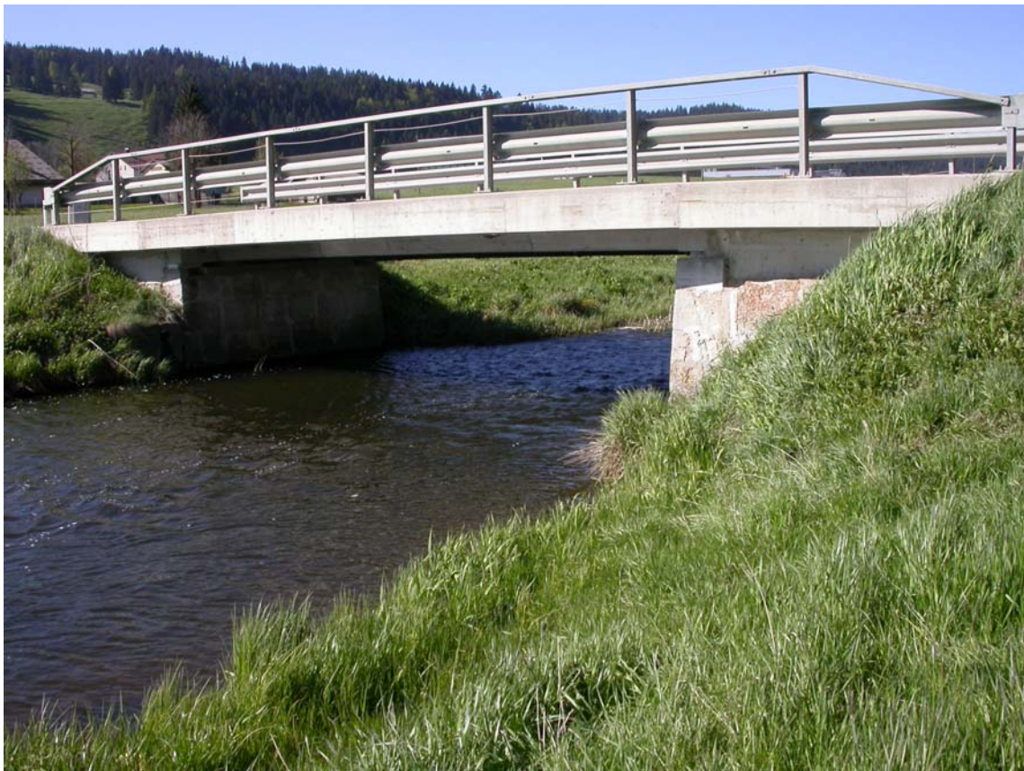
Le transport intense des sables et graviers des carrières de Praz Rodet a nécessité la reconstruction d'un pont moderne et solide.